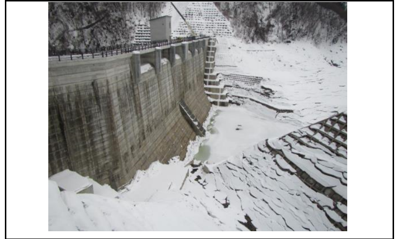
2 ダム上流面(左岸から)