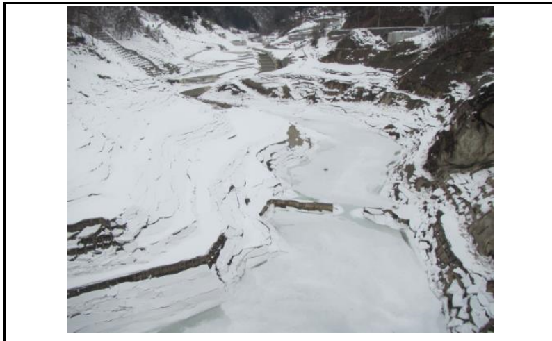
3 貯水池(ダムから上流)