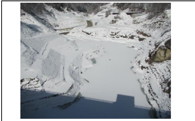
3 貯水池(ダムから上流)