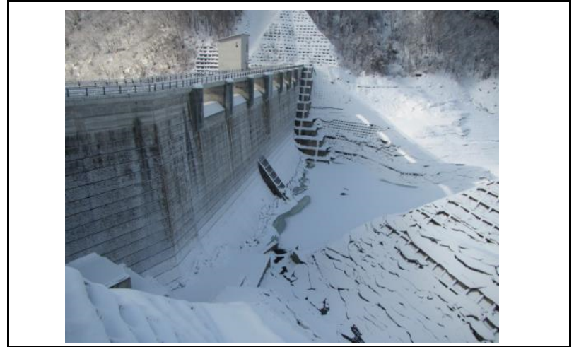
2 ダム上流面(左岸から)