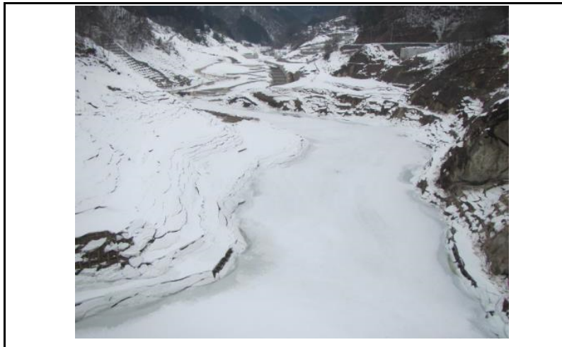
3 貯水池(ダムから上流)