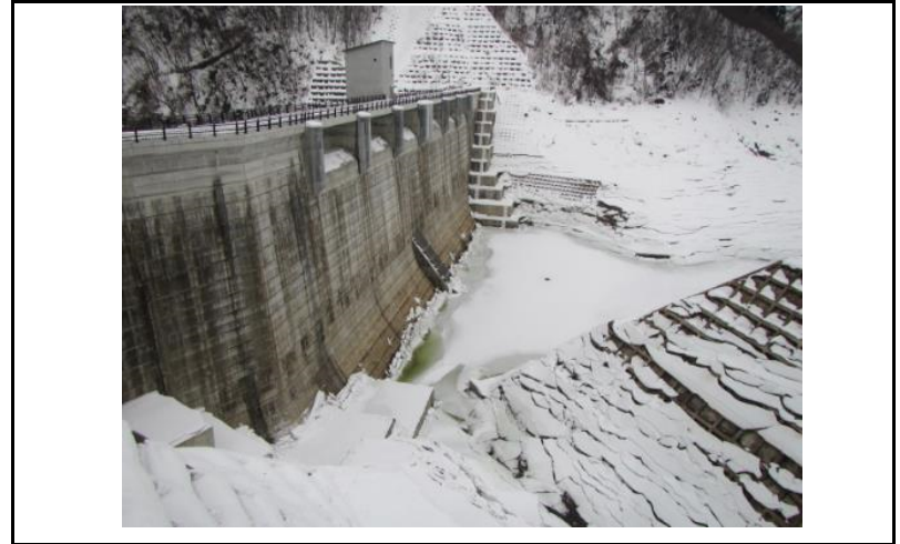
2 ダム上流面(左岸から)