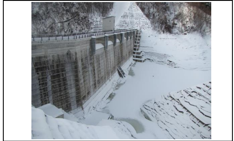
2 ダム上流面(左岸から)