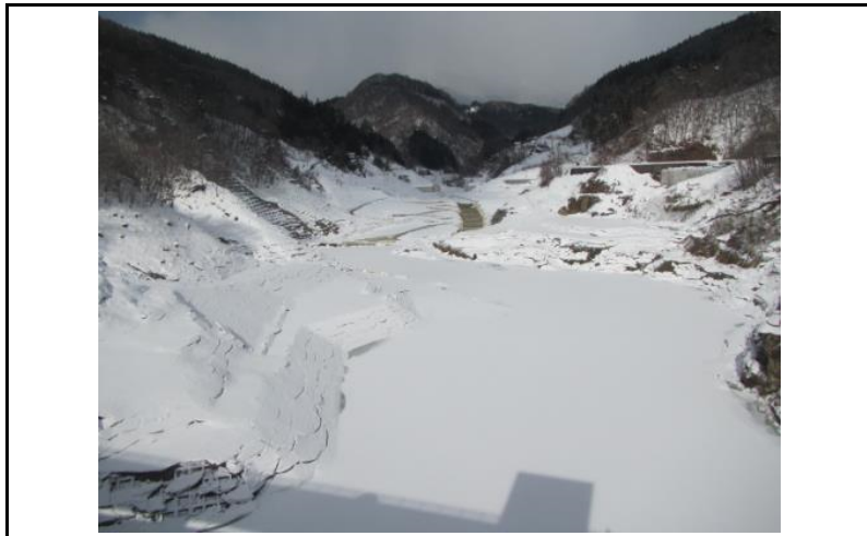
3 貯水池(ダムから上流)