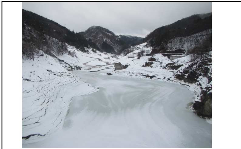
3 貯水池(ダムから上流)