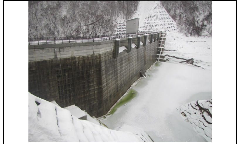
2 ダム上流面(左岸から)