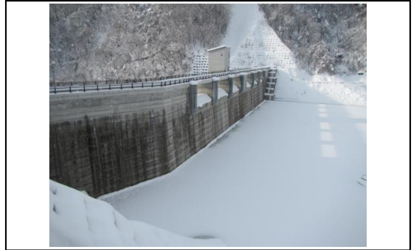
2 ダム上流面(左岸から)