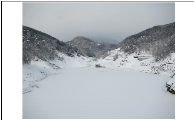
3 貯水池(ダムから上流)