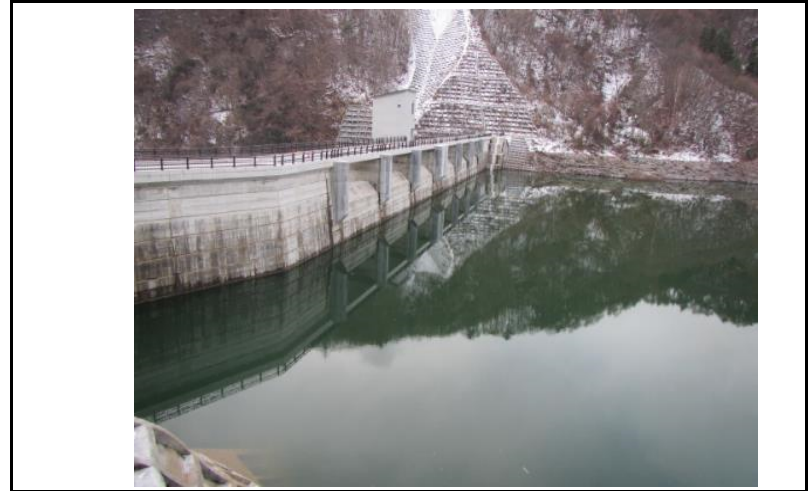
2 ダム上流面(左岸から)