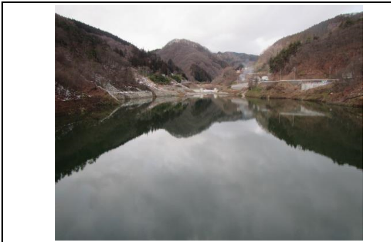
3 貯水池(ダムから上流)