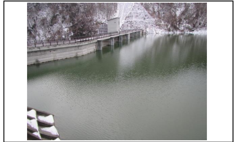
2 ダム上流面(左岸から)