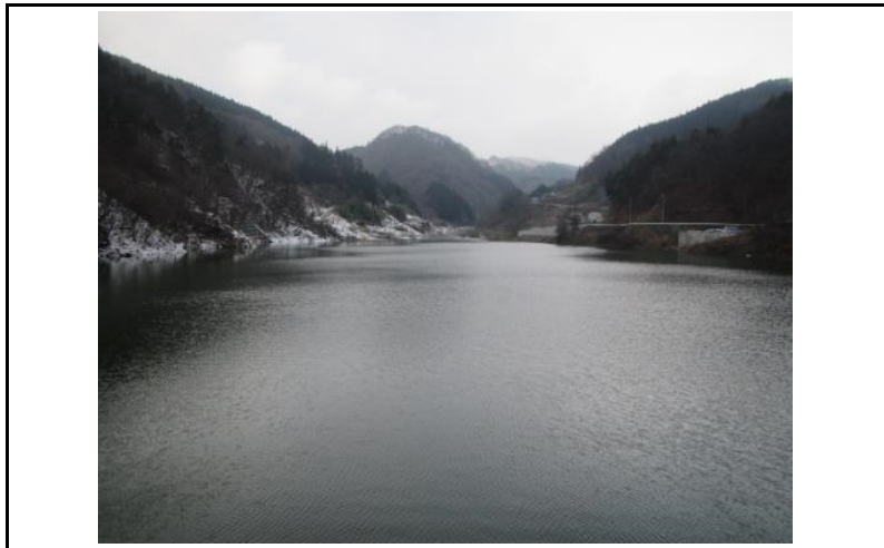
3 貯水池(ダムから上流)