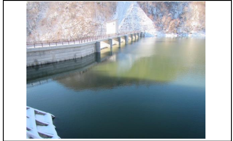
2 ダム上流面(左岸から)