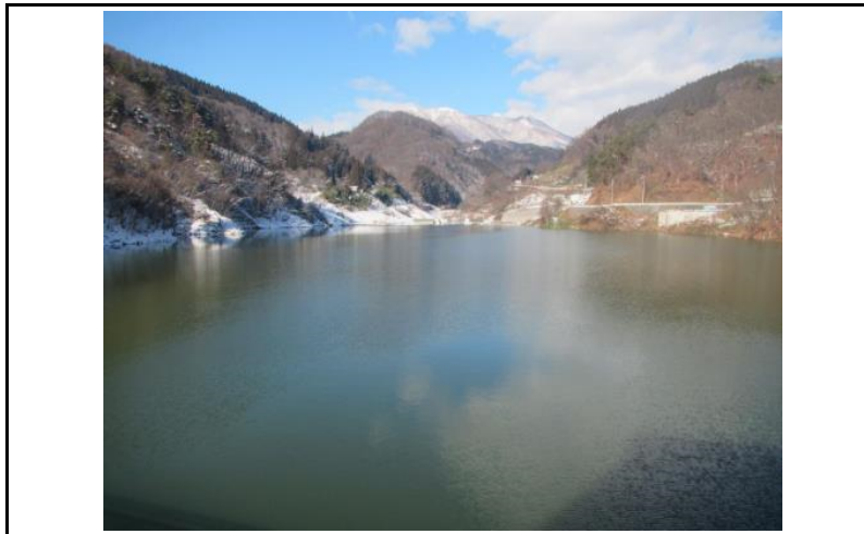
3 貯水池(ダムから上流)