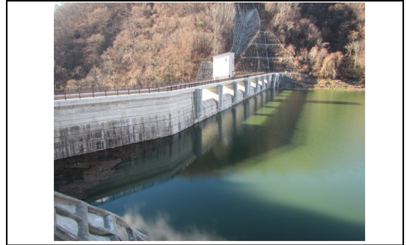
2 ダム上流面(左岸から)