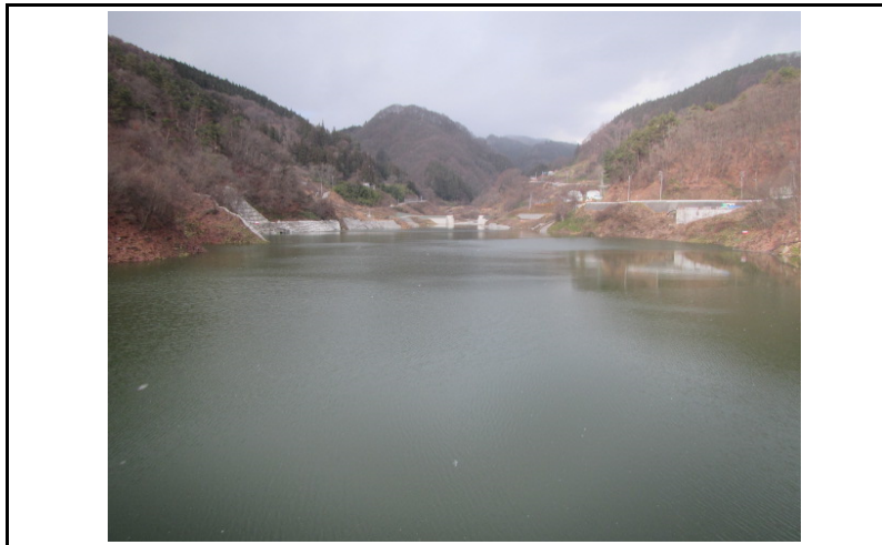
3 貯水池(ダムから上流)