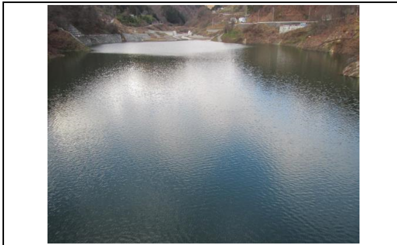
3 貯水池(ダムから上流)