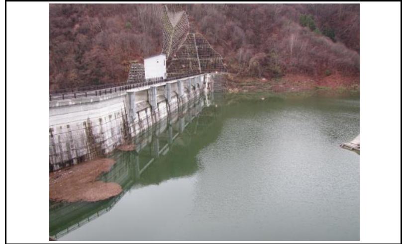
2 ダム上流面(左岸から)