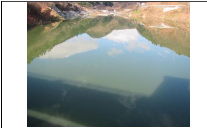
3 貯水池(ダムから上流)