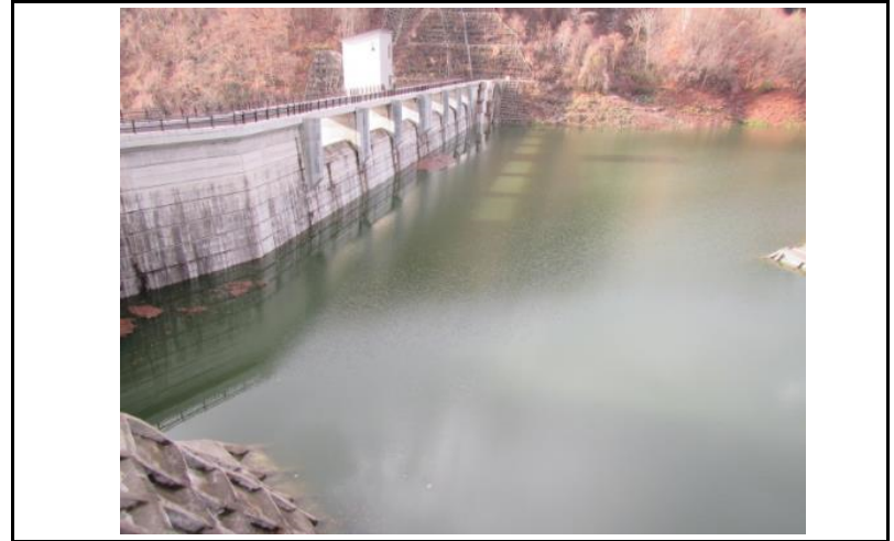
2 ダム上流面(左岸から)