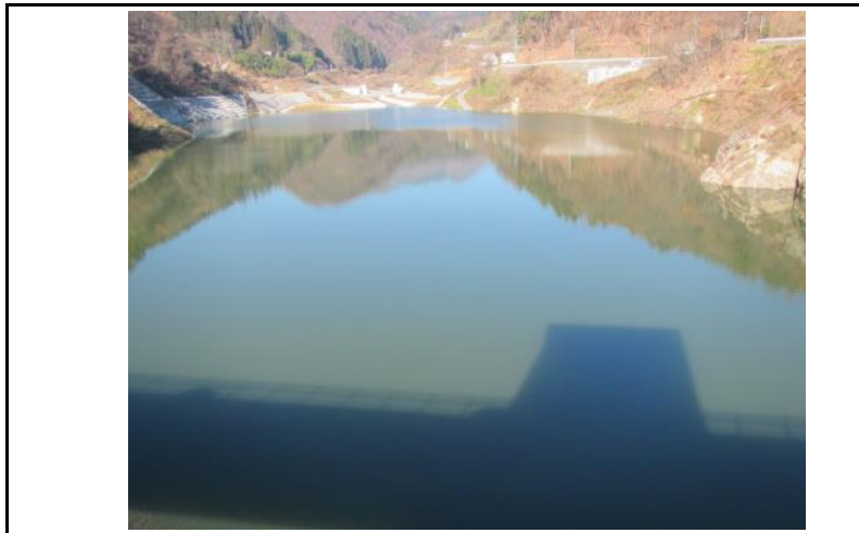
3 貯水池(ダムから上流)