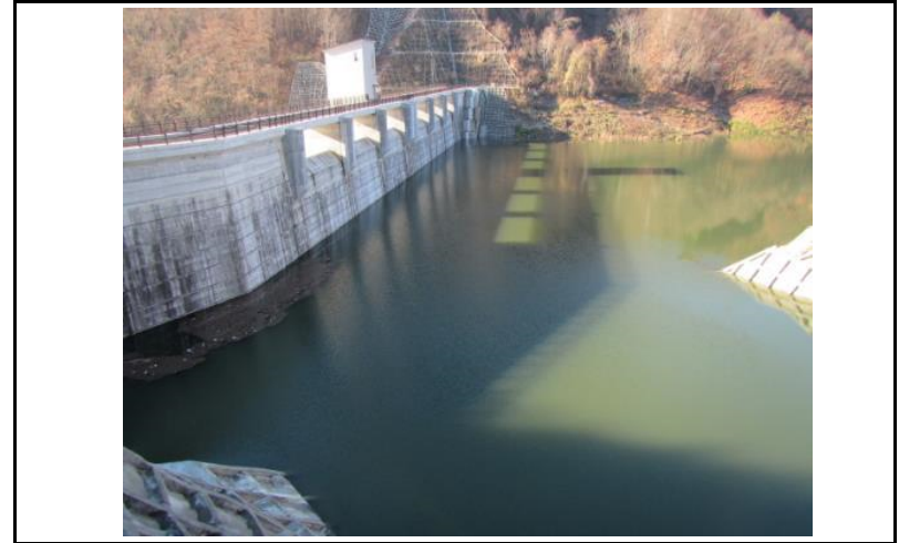
2 ダム上流面(左岸から)