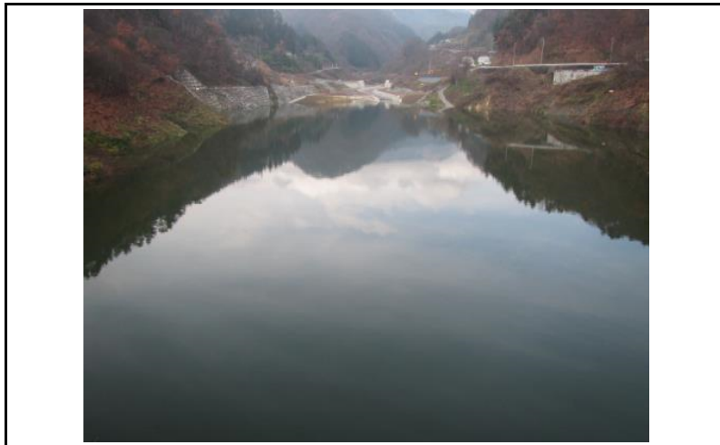
3 貯水池(ダムから上流)