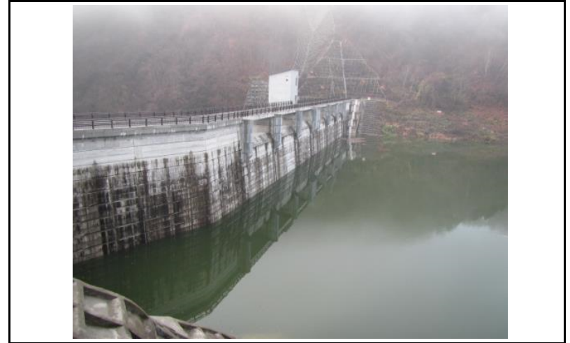
2 ダム上流面(左岸から)