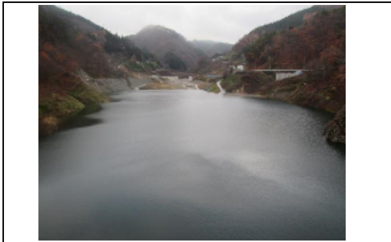
3 貯水池(ダムから上流)