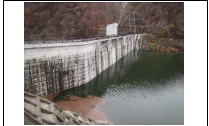
2 ダム上流面(左岸から)