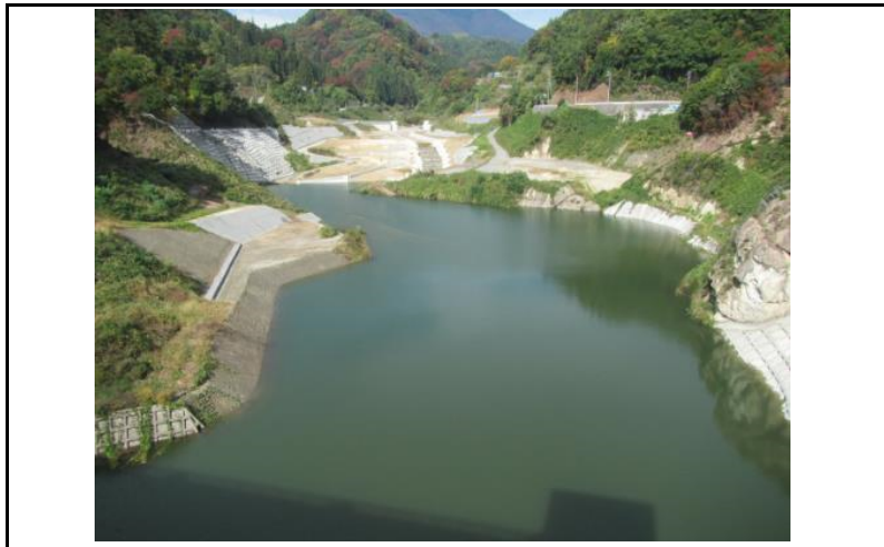
3 貯水池(ダムから上流)