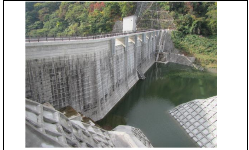
2 ダム上流面(左岸から)