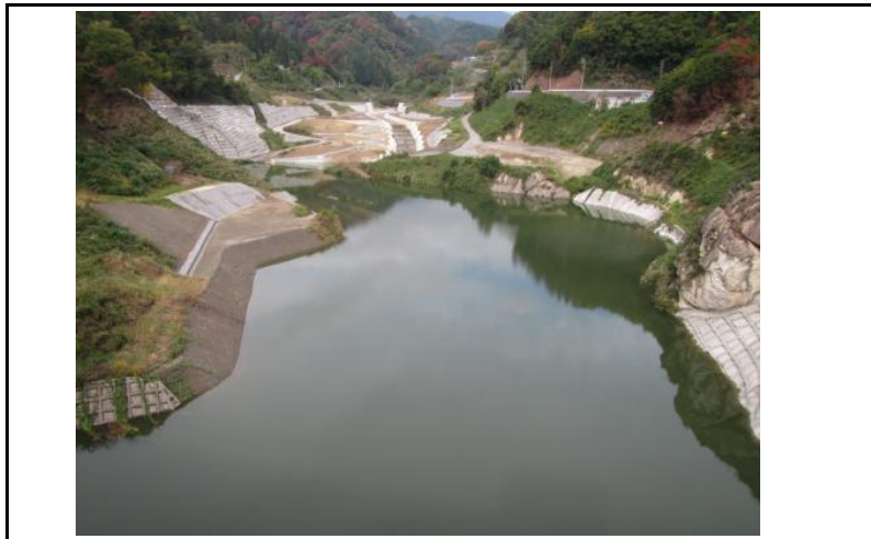
3 貯水池(ダムから上流)