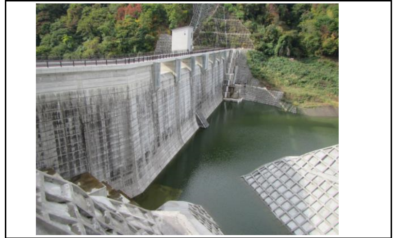
2 ダム上流面(左岸から)