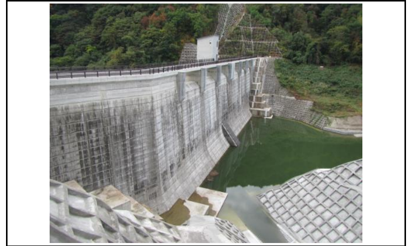
2 ダム上流面(左岸から)