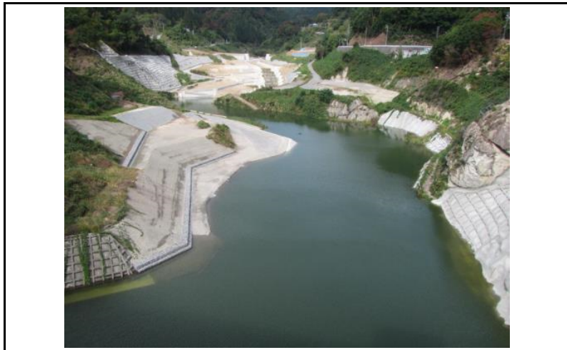
3 貯水池(ダムから上流)